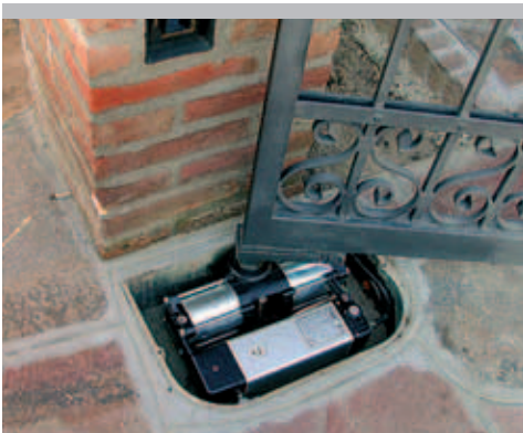
Instalación COMBI 740 a nivel del suelo