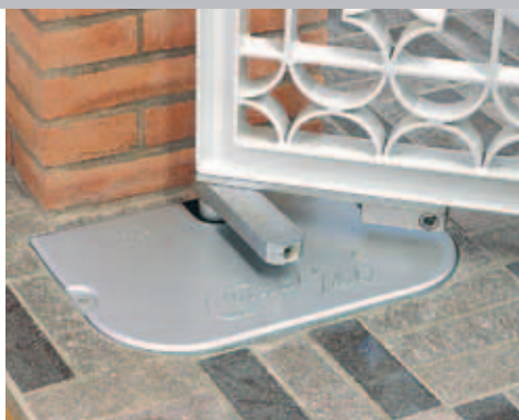
Detalle desbloqueo manual de la hoja