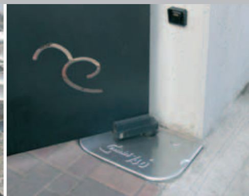
COMBI 740 instalado con cubierta de acero inoxidable